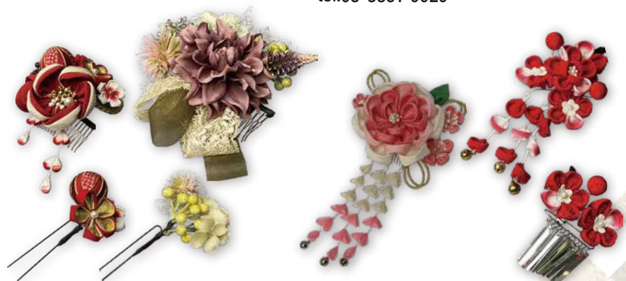
(株)関 東京都台東区東上野6-11-4 tel.03-5830-3911