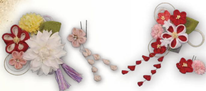
(有)石黒商店 東京都台東区寿3-20-11 tel.03-3841-6747

Japanese traditional hair accessories KAMIKAZARI