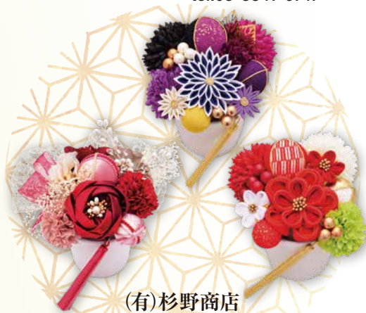
(有)杉野商店 東京都墨田区向島3-20-7 tel.03-3624-6846