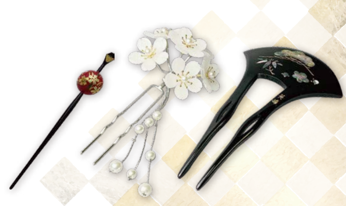
(株)藤崎 東京都江東区亀戸4-46-12-5F tel.03-6807-0341