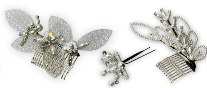
(有)大野商店 東京都台東区鳥越2-7-12 tel.03-3851-9929