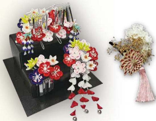
(株)トーカ 東京都台東区柳橋2-16-6 tel.03-3862-7501